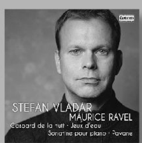
ラヴェル：夜のガスパール ソナチネ 他 C5260