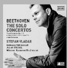
ベートーヴェン：協奏曲集 C7210 (4枚組)

JR&東京メトロ「錦糸町駅」より徒歩5分/東京スカイツリータウン®より徒歩20分